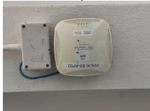
น้ำดื่ม ฟรีไวไฟ