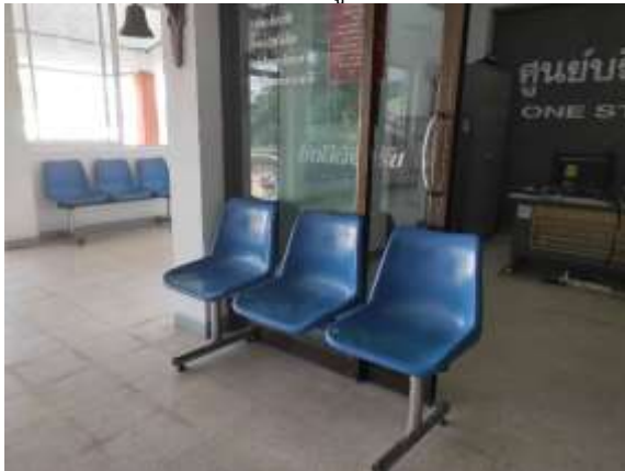
ที่พักนั่งรอสำหรับประชาชนผู้มาใช้บริการ ๓